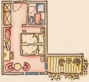
Motus , ca. 20 m 2

Aktive, sportliche Urlauber entspannen in unseren gemütlichen Doppelzimmern Motus.