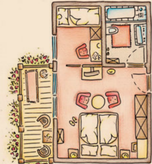
Vita , ca. 35 m 2

In unseren Zweizimmer-Suiten Vita finden all Ihre Lieben genügend Raum zur Erholung.